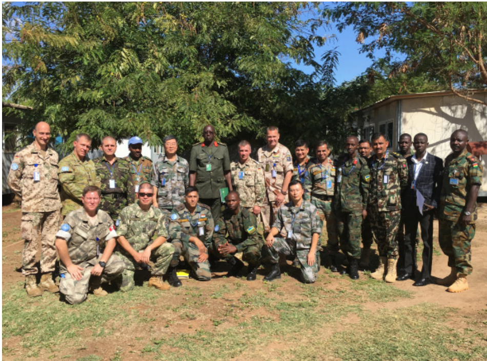
Imagen 3. Conferencia de Lideres de Oficiales de Enlace Militar UNMISS.

A finales de setiembre del 2017 se constató que 31 militares fueron aprobados para prestar servicios en UNMISS desde hace varios meses; sin embargo, no tenían una fecha definida para llegar a Juba (capital de Sudán del Sur). Cuando se efectuó la consulta con la Sección de Personal de la Fuerza, el jefe de personal militar me indicó que ninguno de los 31 militares designados contaba con estudio de seguridad y visa de ingreso por parte del gobierno Sudán del Sur, siendo este el impedimento claro de la violación del acuerdo firmado entre ambas partes, lo que provocó un gran problema en la rotación del personal de Oficiales de Enlace Militar, puesto que muchos militares terminaban su misión y regresaban a sus países sin haber sido relevados por sus pares entrantes, lo que coloca en algunos casos a los equipos de oficiales de enlace militar al 60% de su capacidad operativa.