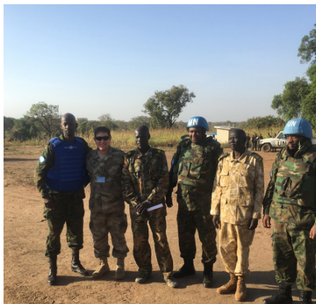
Imagen 1. Durante un patrullaje integrado de asistencia humanitaria

insistía que nadie le había informado nada y que no estaban autorizados a dirigirse hacia Liang, a pesar de los múltiples intentos de negociar el libre pase del convoy de UNMISS e indicarle al oficial del SPLA que estaba incumpliendo el SOFA, por lo que el convoy tuvo que retornar a la ciudad de Malakal sin poder cumplir con la misión.