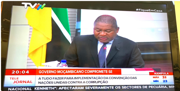
FIGURA 9 Declaración Conjunta con el Presidente de Mozambique en el tema de combate a la corrupción, TVM Televisao de Mocambique, Maputo 2020