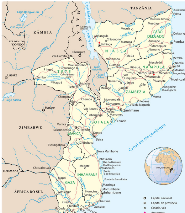
FIGURA 1 Mapa y bandera de Mozambique

Mozambique es un país de África Austral, que tiene un rol importante en el Océano Índico, tanto por su ubicación geográfica como por su historia y cultura. Posee una larga costa de unos 2,500 km., que se extiende desde Tanzania hasta Sudáfrica; el país está situado en la costa del Océano Índico, con cerca de 30 millones de habitantes (2020). Fue la única colonia portuguesa en la región, rodeado por seis países anglófonos, ex-colonias inglesas. Su nombre proviene de la isla de Mozambique, donde los portugueses establecieron un puesto comercial en el siglo XVI. Antes de la llegada de los portugueses, Mozambique estaba habitado por pueblos bantúes, que practicaban la agricultura y la metalurgia, y por comerciantes árabes, que introdujeron el islam y el comercio con el Oriente Medio y la India.