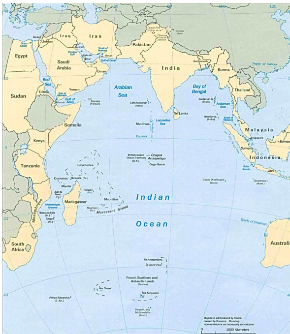
FIGURA 2 Mapa del Océano Índico

Mozambique ha sido un punto de encuentro entre diferentes pueblos y culturas que han navegado por el Océano Índico a lo largo de la historia. Desde el siglo VII al XI, se desarrollaron ciudades portuarias swahili, que comerciaban con mercaderes de Somalia, Etiopía, Egipto, Arabia, Persia e India, y que difundieron el islam y el idioma swahili en la región. En el siglo XVI, los portugueses llegaron a Mozambique y establecieron un puesto comercial en la isla de Mozambique, que dio nombre al país y que fue la capital de la colonia hasta 1898. Durante la época colonial, Mozambique fue parte del imperio portugués, que se extendía por el Océano Índico, incluyendo Goa, Macao y Timor Oriental. Después de su independencia en 1975, Mozambique se integró en la Comunidad de Países de Lengua Portuguesa (CPLP), una organización que agrupa a países que comparten el idioma portugués y que tienen vínculos históricos y culturales.