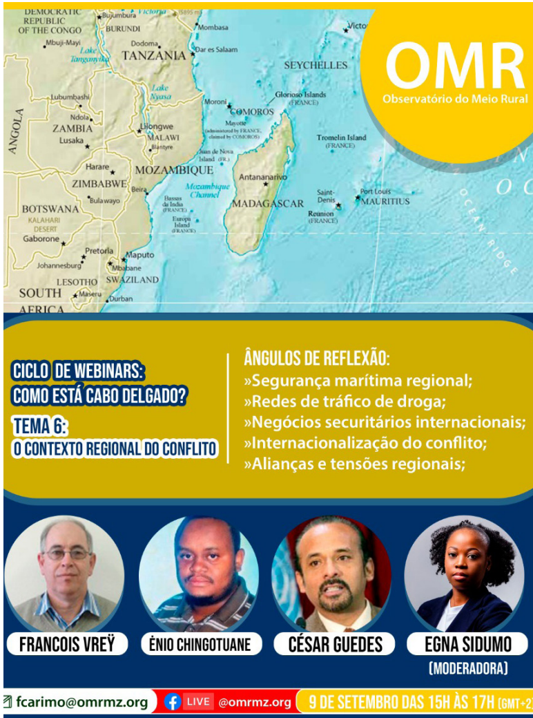
FIGURA 10 Capacitación por medio virtual en seguridad marítima y combate al narcotráfico. Maputo 2020.