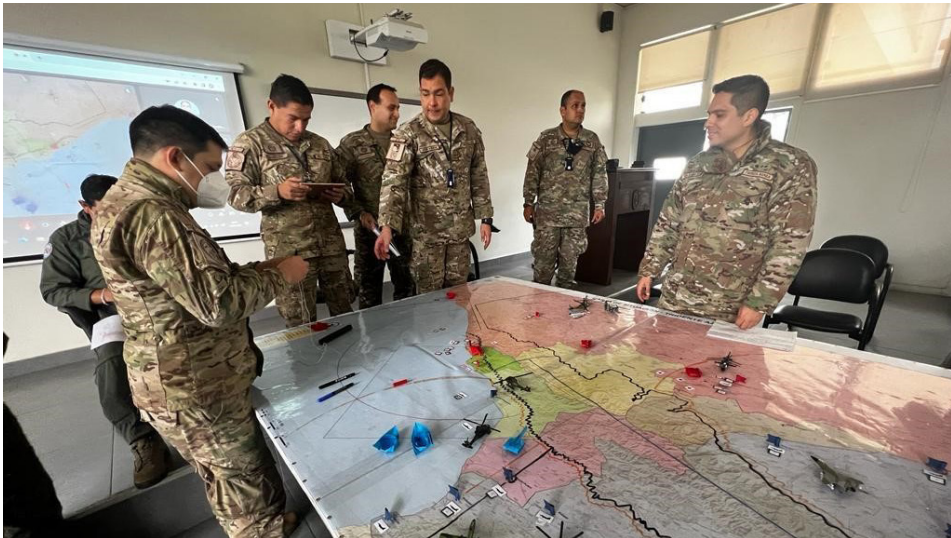
CUADRO 1 Juegos de Guerra, Programa de Comando y Estado Mayor FAP