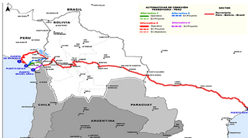
FIGURA 4: Mapa del CFBC en la región de Perú, Bolivia y Brasil que ha despertado el interés de la China.