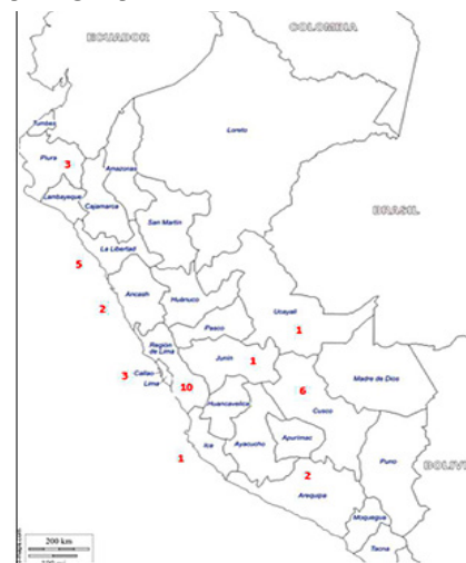
FIGURA 3: Convenios de hermandad entre Perú y China por región peruana.

Estos convenios están relacionados a una serie de inversiones que ha realizado el RP de China con el Perú. Para este caso, el desarrollo de infraestructura en el año 2018, a través de estas hermandades, ha permitido el crecimiento en las áreas descritas en la Tabla 4. De la misma manera, China despertado el interés sobre el desarrollo del proyecto Corredor Ferroviario Bioceánico Central (CFBC). Según Novak y Namihias (2017) estos pueden ser algunos de los